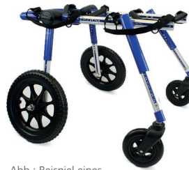
Abb.: Beispiel eines konfektionierten Hunderollwagens

4 Räder (zur zusätzlichen Entlastung der Vorderläufe)