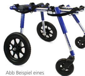
Abb Beispiel eines konfektionierten Hunderollwagens

4 Räder (zur zusätzlichen Entlastung der Vorderläufe)