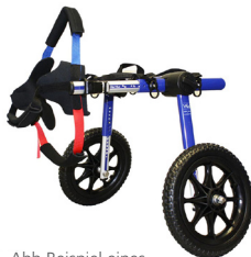
Abb Beispiel eines konfektionierten Hunderollwagens

2 Räder (bei schwachen bis gelähmten Hinterläufen)