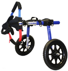
Abb.: Beispiel eines konfektionierten Hunderollwagens

2 Räder (bei schwachen bis gelähmten Hinterläufen)