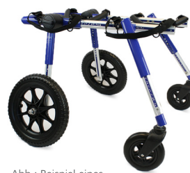
Abb.: Beispiel eines konfektionierten Hunderollwagens

4 Räder (zur zusätzlichen Entlastung der Vorderläufe)